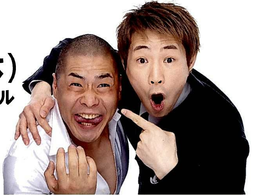
【お笑いコンビ「松本ハウス」】

「タモリのポキャブラ天国」「進め！電波少年」などで人気を博したお笑いコンビ。ハウス加賀谷が幻覚・幻聴などの統合失調症が悪化し1999年に活動休止。その後、入院生活を経て「松本ハウス」復活までの10年間を綴った感動の秘話『統合失調症がやってきた』を出版。お笑い芸人として活躍する一方、こころの健康や統合失調症の話に全国からひっぱりだこな毎日。『相方は、統合失調症』(幻冬舎刊)好評発売中！